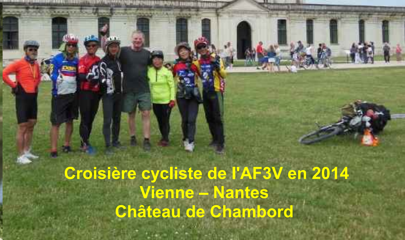
Croisière cycliste de l'AF3V en 2014 Vienne – Nantes Château de Chambord